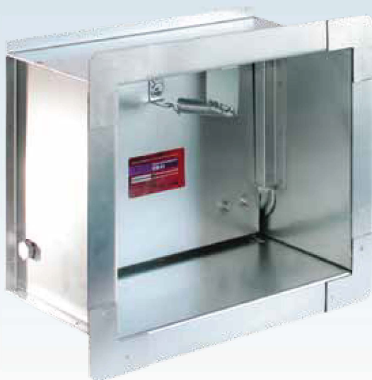
Клапан КПВ.01 КИД (02;03) стенового типа