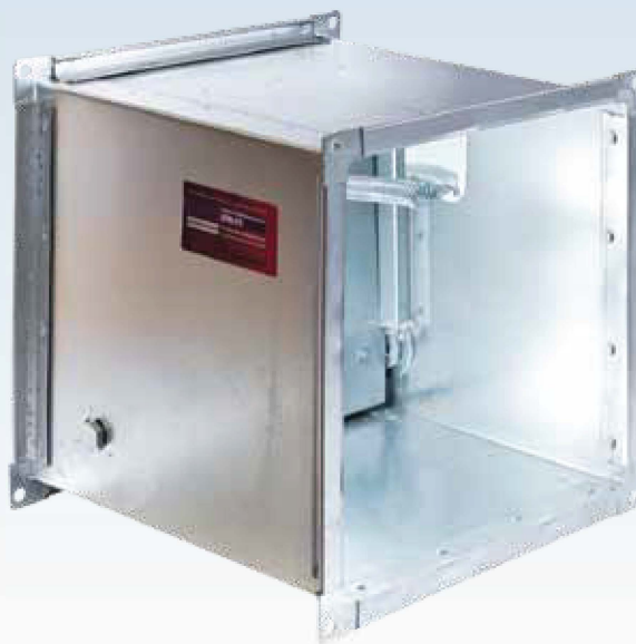
Клапан КПВ.01 КИД (02;03) канального типа