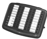
Консоль секретаря 3Com 3105