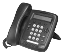
Телефон со спикером 3Com 3101 Basic