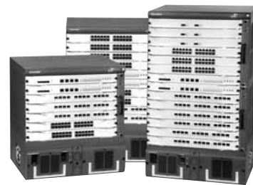
Семейство коммутаторов 3Com 8800

Модульные и стекируемые коммутаторы (продолжение таблицы на стр. 14-15)