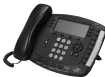
Телефон для руководителя 3Com 3103 Manager