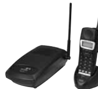
Беспроводной телефон 3Com 3106