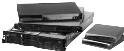
Сервера и шлюзы 3Com VCX IP