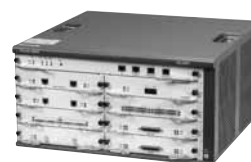
Маршрутизатор 3Com 6080