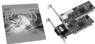
3Com решение встраиваемого МЭ