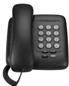
Телефон 3Com 3100

Для оценки инфраструктуры сети и определения проблем которые могут повлиять на качество звука, сервис 3Com Voice Readiness имитирует передачу голосового трафика через сеть передачи данных. Опытные инженеры анализируют полученные результаты и выдают рекомендации для подготовки сети к внедрению системы передачи речи по IP I(VoIP). Эта профилактическая услуга позволяет заказчикам избежать непредвиденных затрат и проблем после установки ПО.