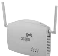
Точка доступа 3Com Wireless LAN 8760