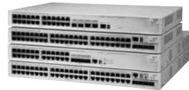
Семейство коммутаторов 3Com 4500