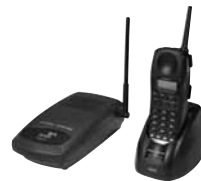
Беспроводной телефон 3Com 3107