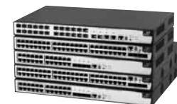
Семейство коммутаторов 3Com 5500G