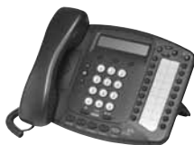
Телефон для организаций 3Com 3102 Business