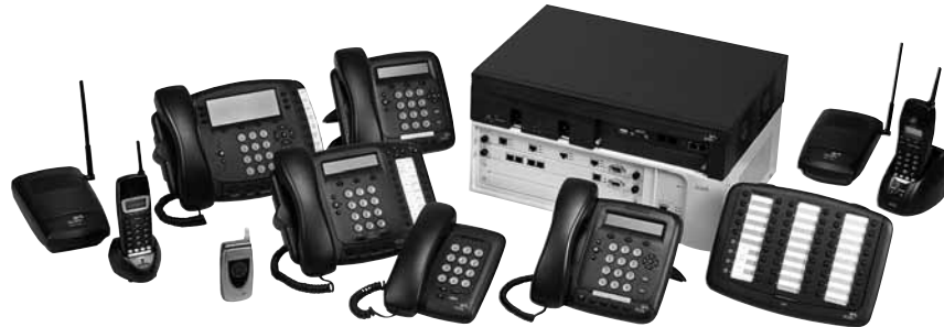
Аналоговая телефонная система 3Com NBX V3001R с шасси расширения и IP телефонами