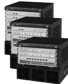
Семейство коммутаторов 3Com 7700