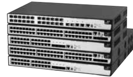
Семейство коммутаторов 3Com 5500