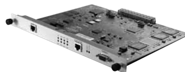
Плата 3Com NBX T1/PRI